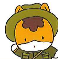
群馬県のマスコット 「ぐんまちゃん」

この夏、群馬県バス協会と県内乗合バス事業社6社、群馬県・前橋市・高崎市では、 小学生の夏休み中の小さな冒険を応援します。