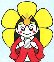
伊勢市の観光PRキャラクター はなてらすちゃん