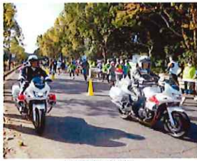
奈良県警白バイ隊が先導