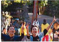
カメラに向かってポーズをとるランナー