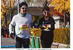
ベアリレーマラソンでタスキリレー