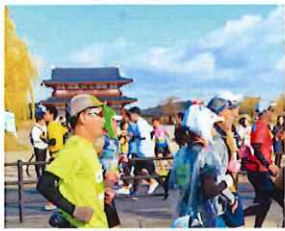
平城宮跡前を走るランナー