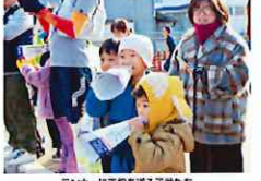
ランナーに声援を贈る子供たち