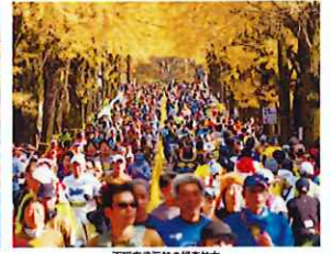
天理市役所前の競合歩道