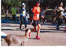
鹿と出会うのも奈良マラソンならでは