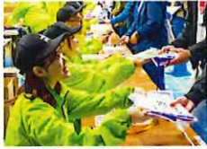
笑顔でランナーに対応するボランティア