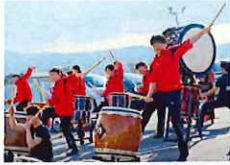
初体験演奏でランナーを応援