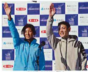
選手監督する2023年の優勝者