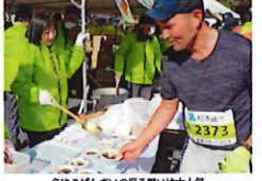
名物のぜんざいを振る舞うは大人気