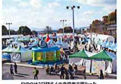
EXPOは2日間多くの来場者で賑わった

NEW ▶奈良県庁大・大山前→興隆寺 一宮→法皇御所 →平ノ池(池上段)まで 8:30頃~15:00頃 ▶大宮通り(国道369号) 二条大路南5丁目~南天 8:30頃~10:40頃 ※多数のランナーが走行中は、横断ができません。奈良市役所東方の仮道(仮1)で迂回もご利用ください。 ▶興隆寺→法皇御所 8:30頃~10:50頃 奈良1車線のみ両側通行可 ▶奈良県庁大・大山前→興隆寺 9:10頃~11:00頃 ▶天理山(国道169号)北端 →山之辺町南→高野町 9:20頃~11:40頃 ※コースにつながる道路も規制されます。最終ランナー通過後、順次解除します。周辺道路の渋滞、路線バスの遅延、遅休にご注意ください。沿道での応援に際しては、大会関係者の指示があれば、それに従ってください。