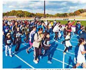
ミニ奈良マラソンには多くの小学生も参加